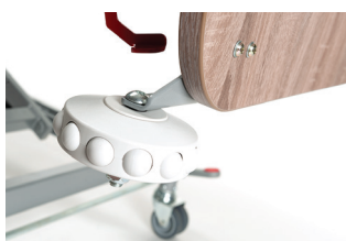
Protezioni per pareti