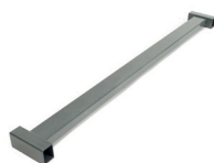
Prolunga (20 cm) per la superficie di appoggio