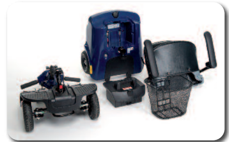
Smontaggio facile per il trasporto

Scoter per un utilizzo misto ma prevalentemente all'interno. Confortevole e pratico, Antares può essere smontato in 4 parti in breve tempo senza chiavi.