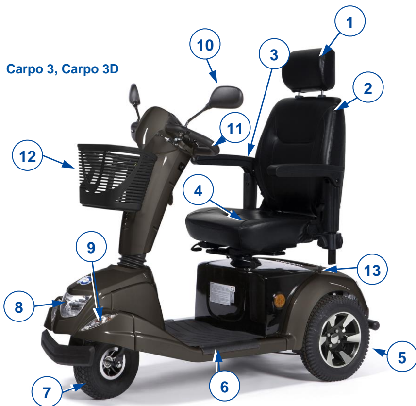
Carpo 3, Carpo 3D