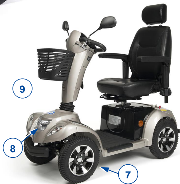
Carpo 4, Carpo 4D